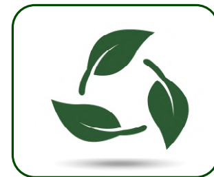
Formulé sans synergiste (PBO) de synthèse

*Ne jamais appliquer sur une personne, un animal ou un couchage en usage.