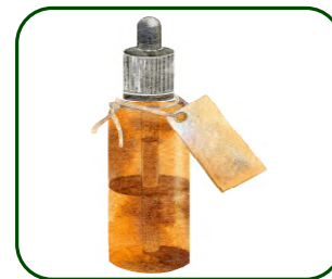
Huiles essentielle végétales