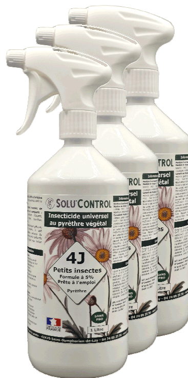
3 Litres (3x1L)